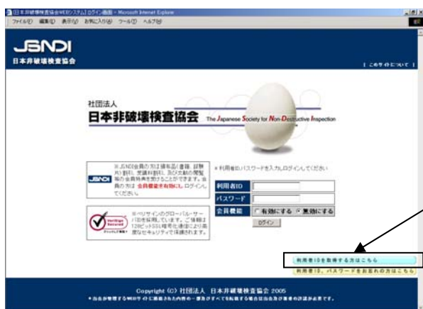
図2 WEB システム ログイン画面

WEB システムには、前ページの図1中D.の箇所からログイン画面（図2参照）へアクセスでき、ID とパスワードを入力することにより、ログインできる。（図3参照）尚、ID とパスワードを取得するためには、図2中のEから利用者登録を行う必要がある。