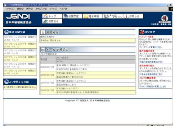
図3 WEB システム（個人）ページ